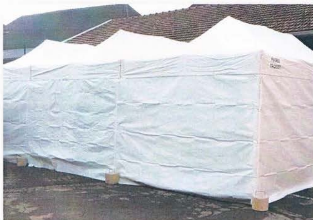
Tentes de réception achetées en 2018