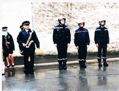
Les Sapeurs Pompiers