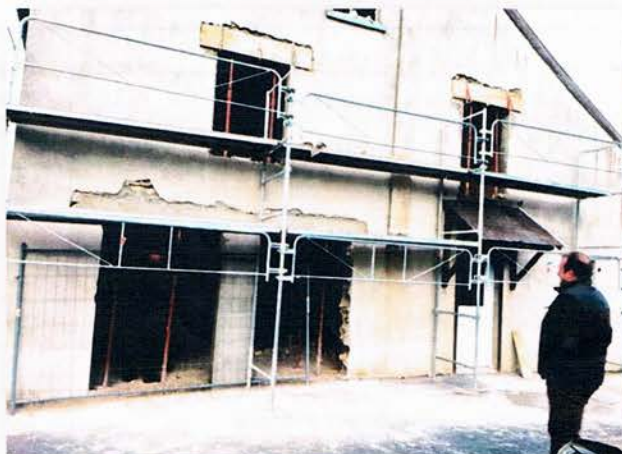
Travaux 2ème logement de BOUQUIGNY