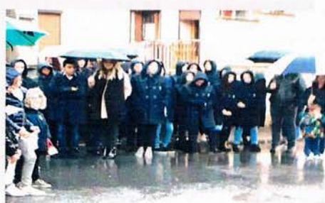
Les élèves de l'école Tersac Excellencia en Champagne