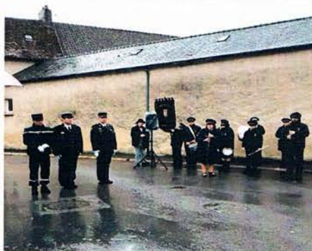
La Musique Municipale de MONTMIRAIL