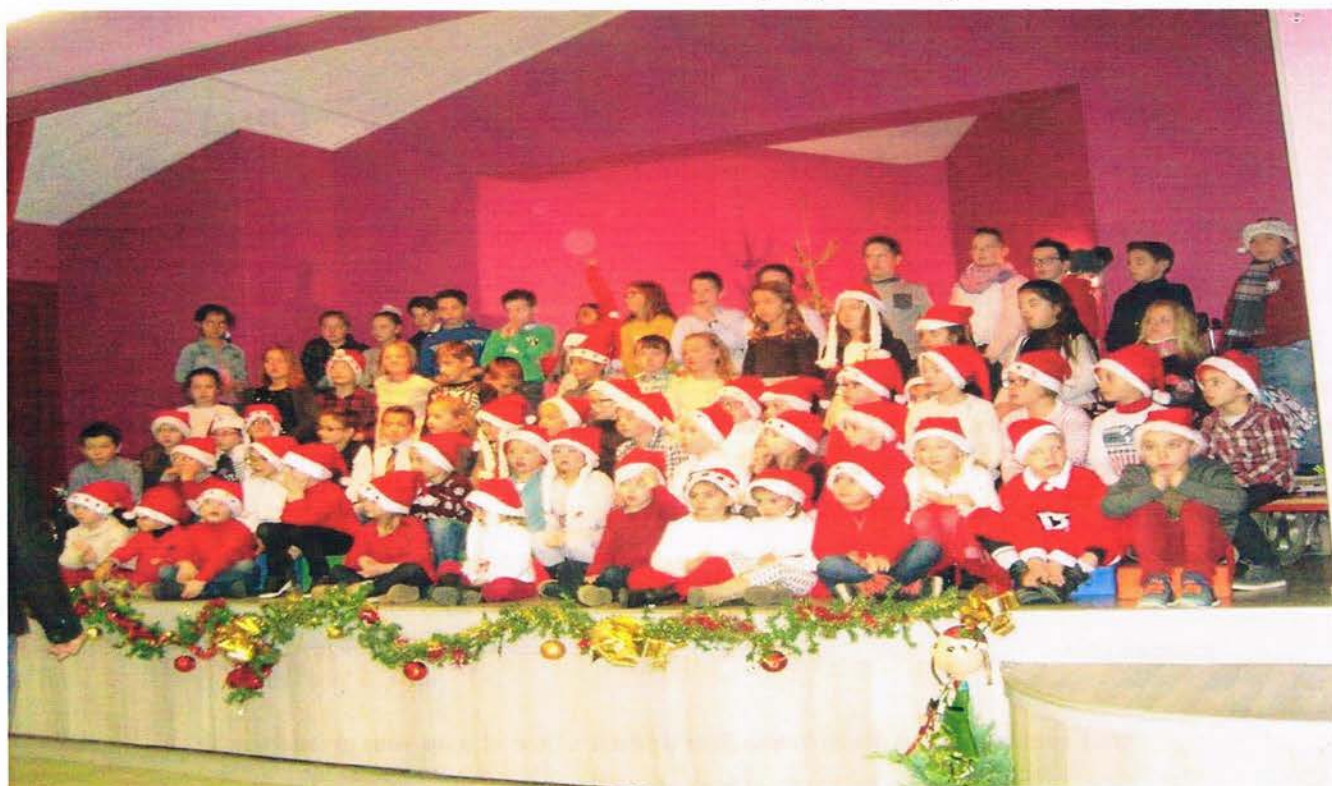
SPECTACLE DE NOEL DU VENDREDI 9 DÉCEMBRE