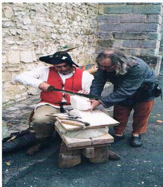
JOURNÉE DU PATRIMOINE