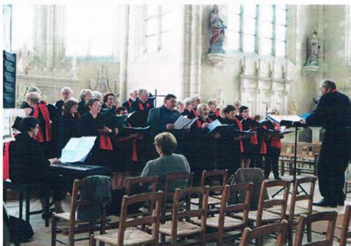
FETE DE LA MUSIQUE